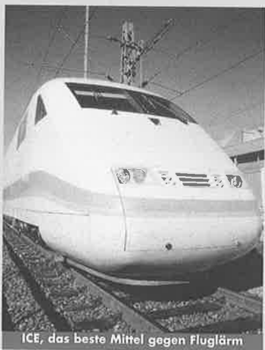
ICE, das beste Mittel gegen Fluglärm

Ein neuer Flughafen kann sich nur dann weltweit durchsetzen und Investoren anziehen, wenn er 24 Stunden am Tag arbeiten kann. Dann können Flüge aus der ganzen Welt abgefertigt werden, dann gibt es Umsteigemöglichkeiten ohne lange Wege, dann können Fracht- und Postflüge rund um die Uhr starten und landen. Allein deswegen muß er in eine dünn besiedelte Gegend. Gutachten haben hier Sperenberg,